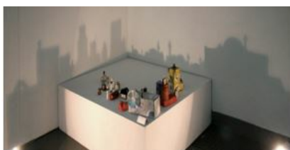
Artista Rashad Alakbarov